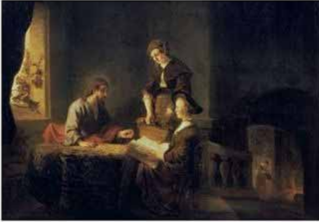
Rembrandt: Kristus i hjemmet til Marta og Maria